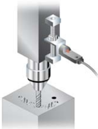
Positionieren bei Prozessaufgaben